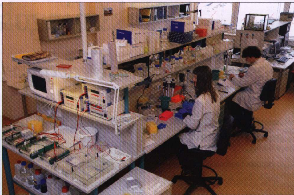
Nukleino rūgščių standartų gamybos padalinys

Ženklius bendrovės pokyčiai įvyko pastarai-